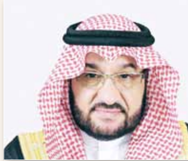
معالي الدكتور عبدالعزيز بن قبلان السراني