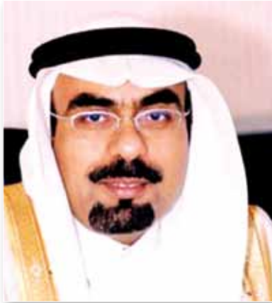
أمين العاصمة المقدسة م. محمد بن عبدالله التويجص

استطاعوا بعد توفيق الله عز وجل إقامة هذا المعرض الرائد الذي سوف يكون له الدور الكبير في تحسين وتطوير وتجويد بيئة سكن الحجاج في المشاعر المقدسة من خلال إشراك القطاع الخاص والشركات والمؤسسات المحلية والخارجية ذات الخبرة في تقديم ما لديها من وسائل فنية وأفكار إبداعية لتجويد وتحسين الخدمة المقدمة لحجاج بيت الله الحرام في المشاعر المقدسة بحيث أصبح المعرض منصة عالمية للشركات والمؤسسات التي تقدم خدماتها لضيوف الرحمن في المشاعر المقدسة بما يحقق رؤية المملكة الطموحة ٢٠٣٠ والبرنامج الناجح للتحويل الوطني في مجال الخدمات المقدمة لضيوف الرحمن.