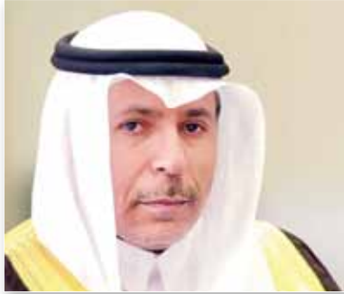
معالي الدكتور مرعي بن حسين القحطاني